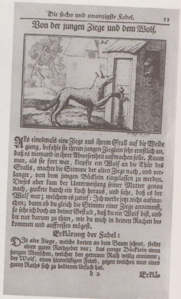
ESOPIS LEBEN UND AUERLESENE FABELN... NÜRNBERG 1731. Nr. 19