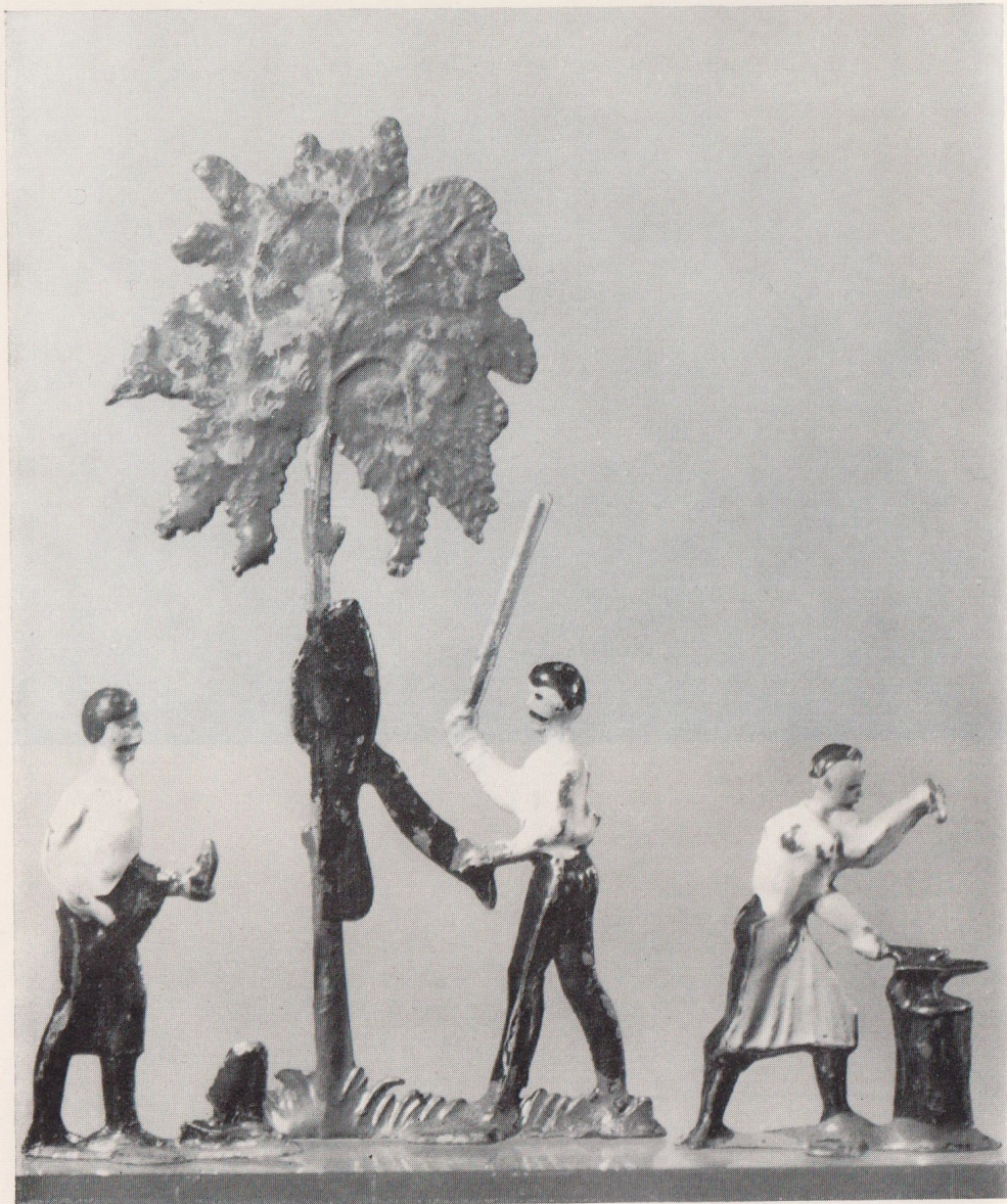
30 Handwerkergruppe mit Stiefelputzer, Kleidungsreiniger und Schmied