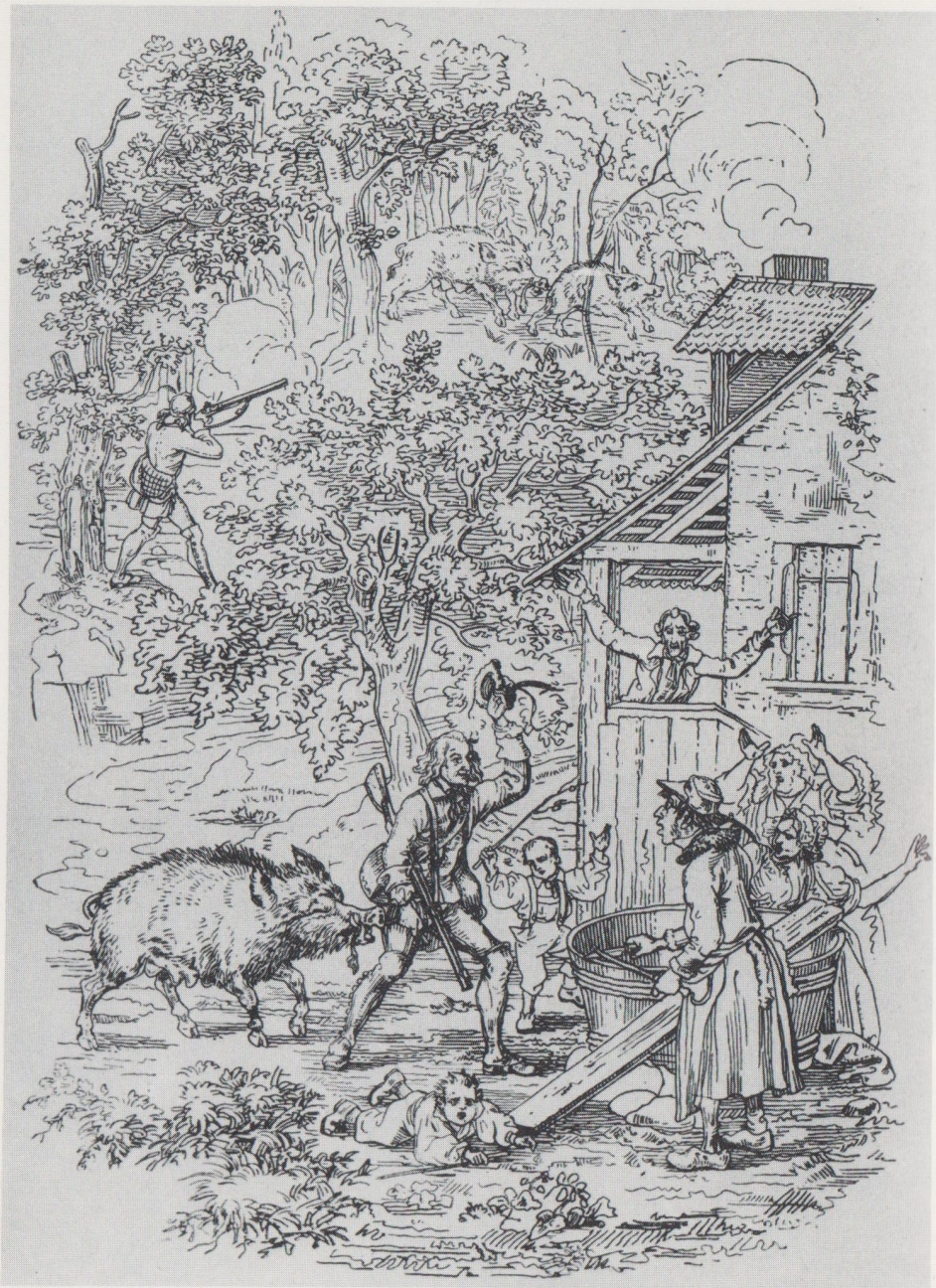
Illustration von Martin Disteli zu den «Abenteuern des Freiherrn von Münchhausen» von R. E. Raspe, Solothurn 1841.